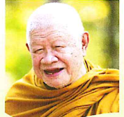
พระธรรมมงคลญาณ