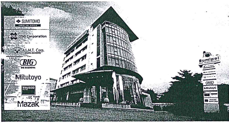
สำนักงานใหญ่ และศูนย์โลจิสติกส์